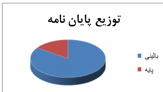
شکل ۱: مقایسه توزیع پایان نامه ها در گروههای آموزشی علوم پایه و بالینی.

از تعداد ۲۴۱ پایان نامه، ۲۰۴ جلد (۸۴/۶۵٪) مربوط به گروه های آموزشی بالینی و ۳۷ جلد (۱۵/۳۵٪) مربوط به گروه های آموزشی علوم پایه (شکل ۱) و اختلاف بین گروه ها معنی دار بود ( p = 0/000 )، بین گروه های آموزشی بالینی نیز اختلاف معنی دار وجود داشت ( p < 0/05 ) و بیشترین تعداد پایان نامه (۵۸) جلد، ۲۴/۰۶٪) مربوط به گروه آموزشی زنان-۲۸ جلد (۱۱/۶۱٪)، کودکان و روانپزشکی، هر یک ۲۶ جلد (۱۰/۷۸٪) بود. کمترین تعداد پایان نامه مربوط به گروه های آموزشی ارتوپدی، چشم پزشکی و جراحی مغز اعصاب بود (شکل ۲). در هر گروه آموزشی نیز توزیع پایان نامه ها میان اعضای هیأت علمی یکسان نبود و در گروه های آموزشی زنان، کودکان و روانپزشکی که تعداد پایان نامه ها بیشتر از سایر گروه ها بود، اختلاف معنی دار بین اعضا هیات علمی وجود داشت ( p < 0/05 ) و برخی اعضای هیأت علمی سهم بیشتر و برخی نیز فاقد پایان نامه بودند.