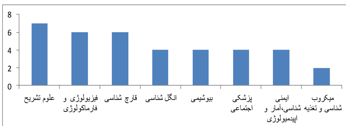
شکل ۳: توزیع پایان نامه ها بین گروه های آموزشی علوم پایه.

آنها معنی دار نبود ( p > 0.05 ). تعداد منابع به کار رفته در پایان نامه های علوم پایه-۴۰/۵۹ و علوم بالینی-۲۲/۳۱ و اختلاف بین آنها معنی دار بود ( p < 0.05 ) و ۳۵/۶۸٪ پایان نامه ها بین ۲۰-۱۰ منبع و ۲۶/۹۷٪ بین ۳۰-۲۰ منبع داشتند و فقط ۱/۶۵٪ موارد بیش از ۱۰۰ منبع استفاده کرده بودند میانگین تعداد منابع پایان نامه های مربوط به علوم پایه برابر ۴۰/۵۹ و بیش از این مقدار در پایان نامه های بالینی (۲۲/۳۱) بود. همچنین از مجموع ۲۴۱ پایان نامه، ۷۹ مورد (۳۲/۷۸٪) به عنوان مقاله به چاپ رسیده بود و اختلاف بین گروه های علوم پایه و بالینی معنی دار بود ( p < 0.05 ) (شکل ۴)